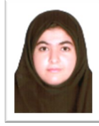
آزمایشگاه زیست (ساقی بناپور ۹.۱)