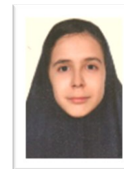
پژوهش (آوا ایجادی ۹.۳)