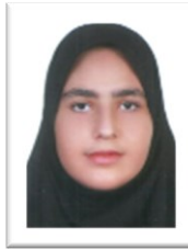
آبدارخانه (طنین حلب چی ۹.۱)