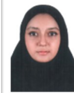
مشاوره پایه نهم (غزل فرزانه ۹.۵)